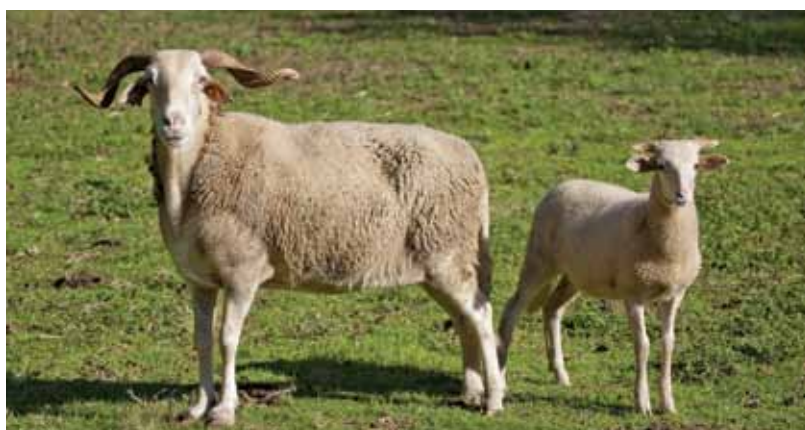
A raça Serra da Estrela lidera nos ovinos com 20.341 animais