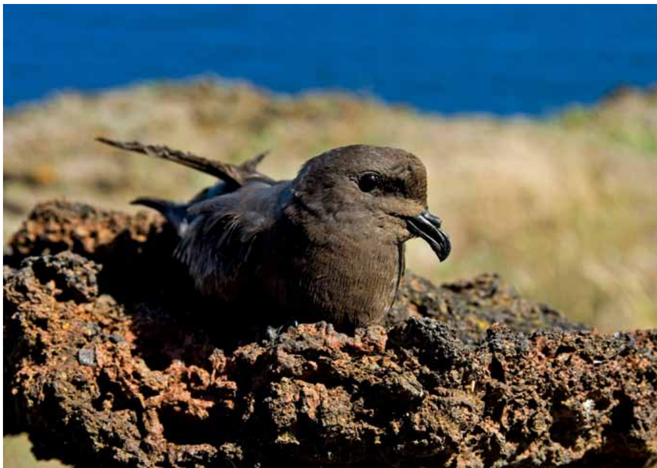
Painho-de-monteiro é a ave de 2021