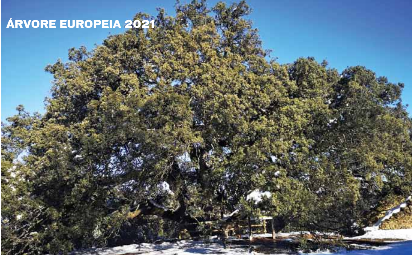
Azinheira Milenar de Lecina ( Quercus Ilex L. ), Huesca, Aragón, Espanha [GPS: 42°13'47.3"N, 0° 02'18.1"E]