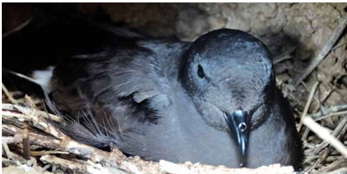
A ave só nidifica no arquipélago dos Açores