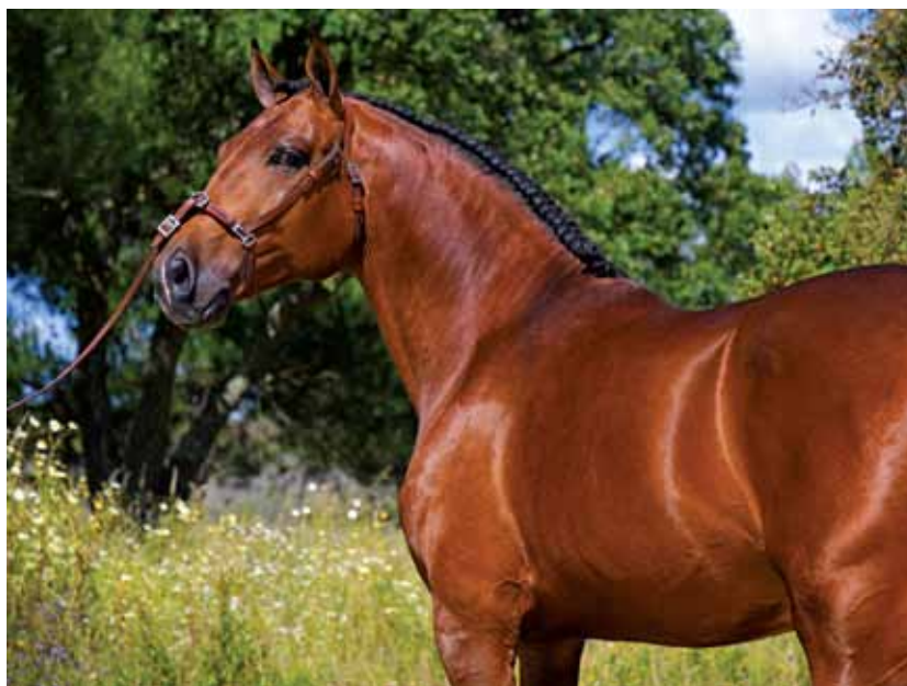
A raça Lusitana é a mais expressiva e existem 13.969 criadores

A versão digital do Catálogo das Raças Autóctones Portuguesas encontra-se disponível nos sites da CAP ( www.cap.pt ) e da DGAV ( www.dgav.pt ) ou directamente no link: https://gpcoz3.s.cld.pt