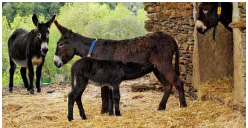
Na categoria dos equídeos, o burro de Miranda ocupa o terceiro lugar