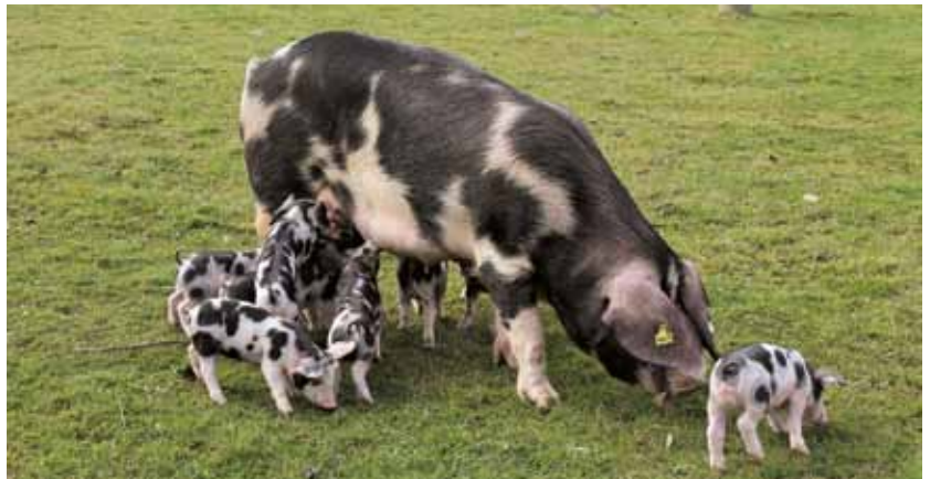
Por sua vez, o Malhado de Alcobça tem apenas 507 registos