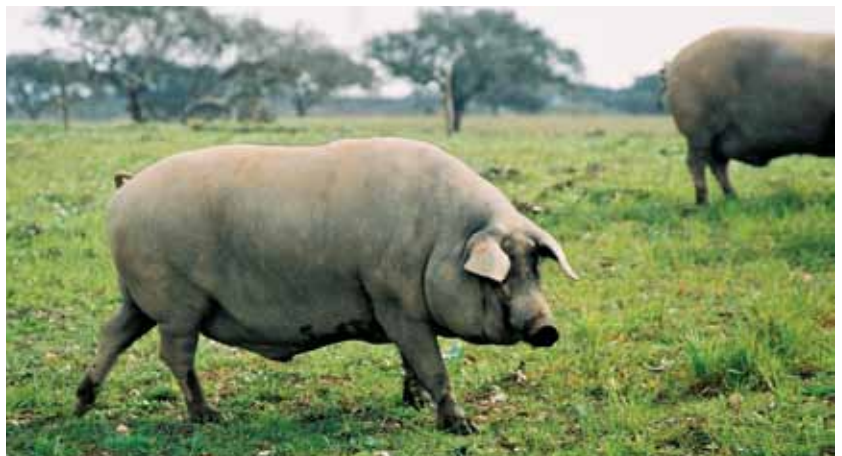
Raça suína Alentejana é a que tem mais animais: 5.025