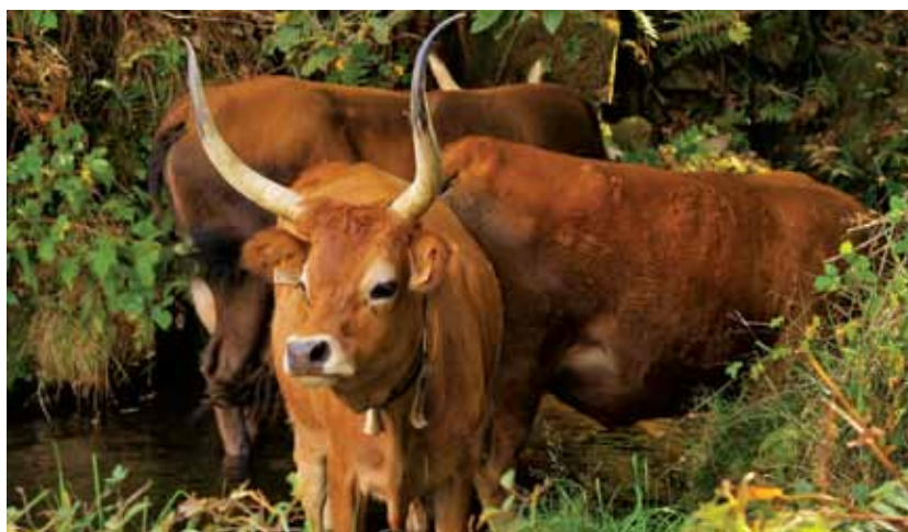
A raça Barrosã detém 7130 animais