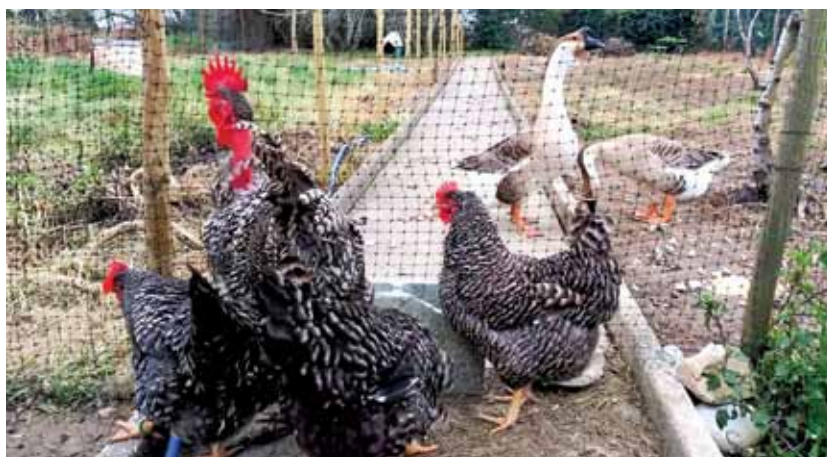
Galinha pedrês, com 6.223 animais, domina os galináceos