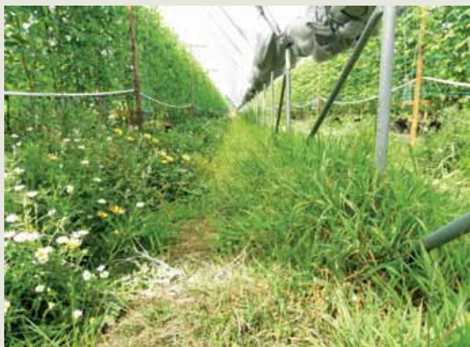
Margem multifuncional em túnel de produção de framboesa