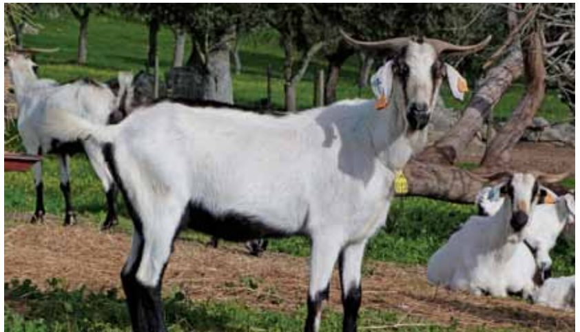
Foram identificadas seis raças de caprinos, uma delas a Serpentina

a) As associações gestoras dos livros de raças com menor número de efectivos