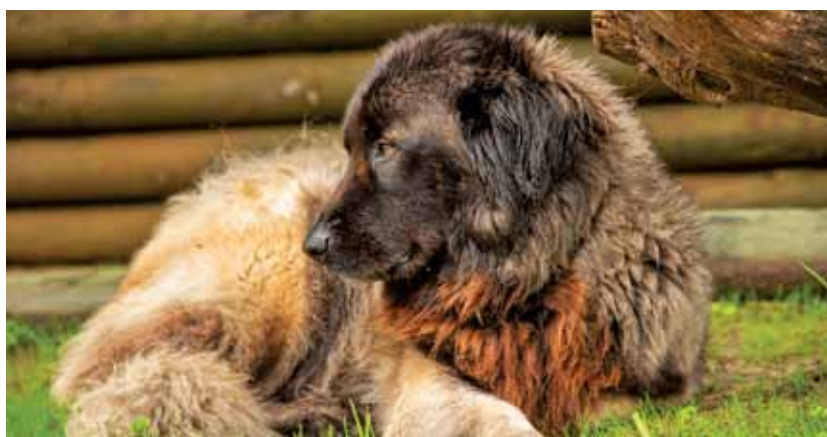
Os canídeos não estão contabilizados, mas estão identificadas 11 raças