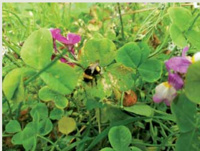
Polinizador em margem multifuncional