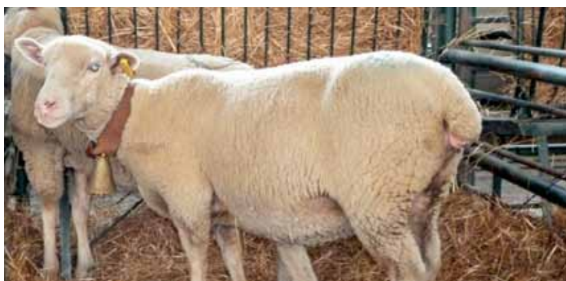
Raça Merina Branca ocupa o quinto lugar nas raças de ovinos