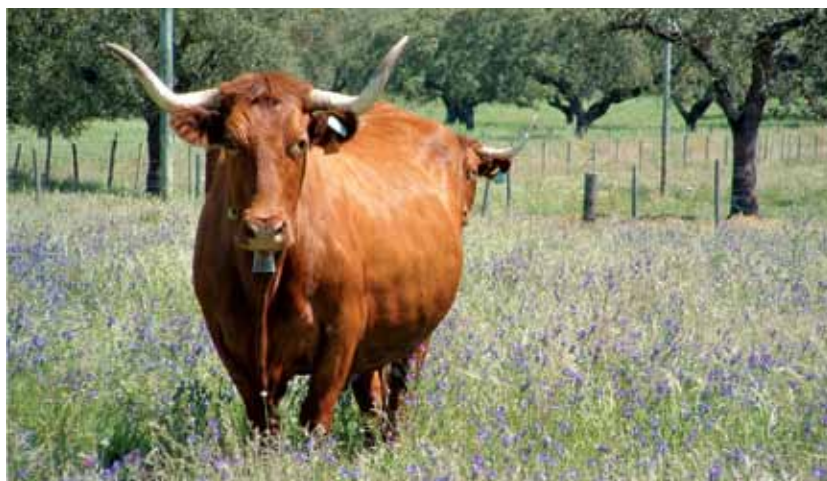
A raça Alentejana destaca-se com 8562 animais puros

Tal implicará o reconhecimento e a justa valorização destes produtos, associada à sua exclusividade, oferecendo a este mercado em crescimento, a garantia da sua superior qualidade e, por isso, do seu valor.